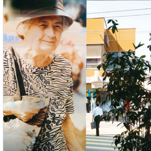
Raiffeisenbank St. Gallen digitale Fotoprints an Fensterfront, Beat Streuli, 2003.

Diese ist jedoch nicht nur thematisch besonders, sondern auch in Bezug auf ihre Fläche. Die meisten Kunstobjekte im öffentlichen Raum nämlich dienen auch einem repräsentativen Charakter für den Auftraggeber und werden so der Sichtbarkeit halber möglichst hoch gebaut. Die stadtlounge jedoch geht in die Breite, ist flächig, nämlich rund 4346 m 2 . Dadurch behält sie im wahrsten Sinne des Wortes die Bodenhaftung und spiegelt so auf sehr schöne Art und Weise die Werte wie Nähe, Offenheit und Sympathie wider, welche so gut zu Raiffeisen passen.