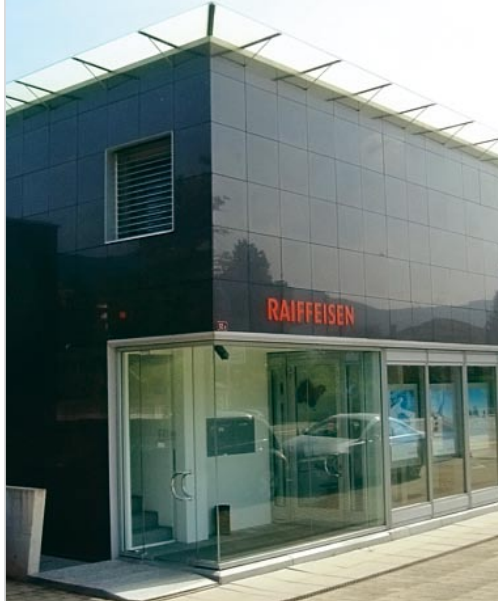
Raiffeisenbank Canobbio-Comano-Cureglia Das Bankgebäude als Kunstwerk Nicola Balestra, Sylvia Crivelli, 2003.

Es ist keine Erfindung unserer Zeit, die Kunst in den öffentlichen Raum zu setzen. Doch im Gegensatz zu älteren Epochen, in denen die Berühmtheiten ihre in Stein gemeisselten Abdrücke aufstellen liessen, bedeutet Kunst im öffentlichen Raum heute meist schlicht eine Aufwertung eines öffentlichen Platzes. Insofern hängt sie mit dem Städtebau eng zusammen. Dieser ist um ein stimmiges Gesamtbild einer Stadt bemüht und setzt