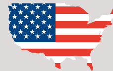
USD Dollars US