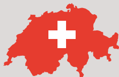
CHF Francs suisses

Celles-ci ainsi que de nombreuses autres monnaies sont possibles (telles qu'AUD, NZD, NOK, etc.).