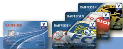
Carte V PAY