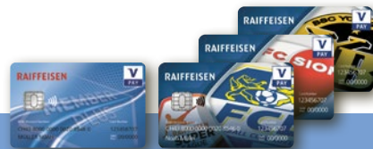
Carte V PAY