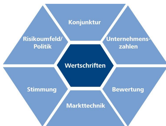
Komplexes Umfeld: Einflussfaktoren auf Wertschriften

Jährlich werden in der Schweiz 60 Milliarden Franken vererbt, rund 260'000 Personen gehen pro Jahr in Pension und im Jahr 2018 gab es 32 neue Lotto-Millionäre. Diese und andere Ereignisse können dazu führen, dass Menschen plötzlich mit einer Menge Geld konfrontiert sind. Es stellen sich Fragen wie: Was soll ich mit dem Geld anstellen? Alles auf ein Sparkonto oder sind Anlagen sinnvoll? Welche Arten von Anlagen eignen sich für mich? Wie optimiere ich die Rendite meines Geldes?