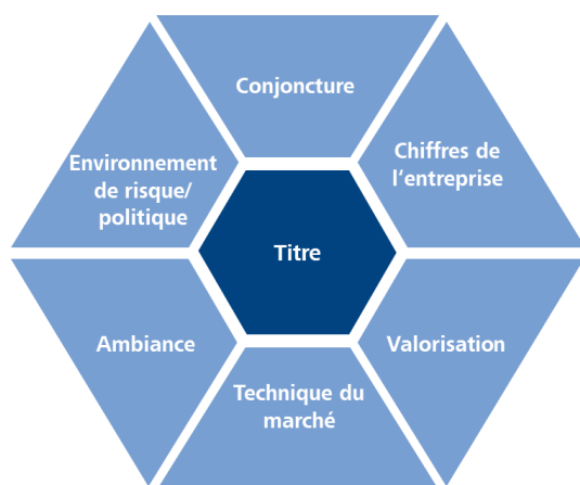
Un environnement complexe: voici les facteurs influençant sur les titres

Chaque année, 60 milliards de francs sont hérités et environ 260'000 personnes partent à la retraite, tandis que 32 Suisses sont par exemple devenus millionnaires au lotto, rien qu'en 2018. Les bénéficiaires sont tout à coup confrontés au fait de disposer d'une grosse somme d'argent au travers de ces événements de la vie, et doivent se poser toutes sortes de questions: que faire de tout cet argent? Tout laisser sur un compte épargne ou le placer? Quels sont les placements répondant le mieux à mes attentes? Et comment optimiser le rendement de mon argent?