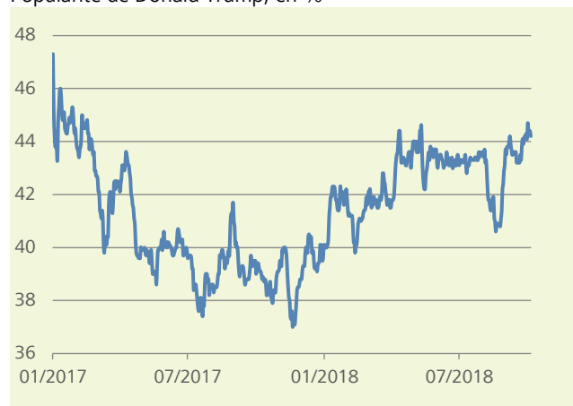
Graphique de la semaine Popularité de Donald Trump, en %