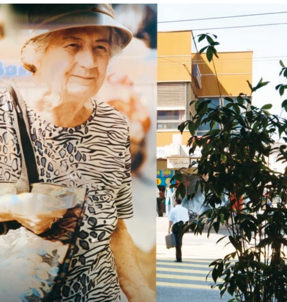
Banque Raiffeisen St-Gall Photoprint digitale sur vitre Beat Streuli, 2003.

manifestation destinée à notre clientèle intitulée «börsenart» (Art de la Bourse). Ces deux événements ont pour but d'encourager les jeunes artistes de talent au niveau national. Cet engagement artistique de Raiffeisen complète les nombreuses initiatives des Banques Raiffeisen au niveau local et régional.