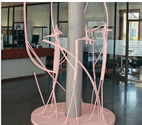
Banque Raiffeisen Wasseramt Souris dansantes en bois de sapin Schang Hutter, 2006.