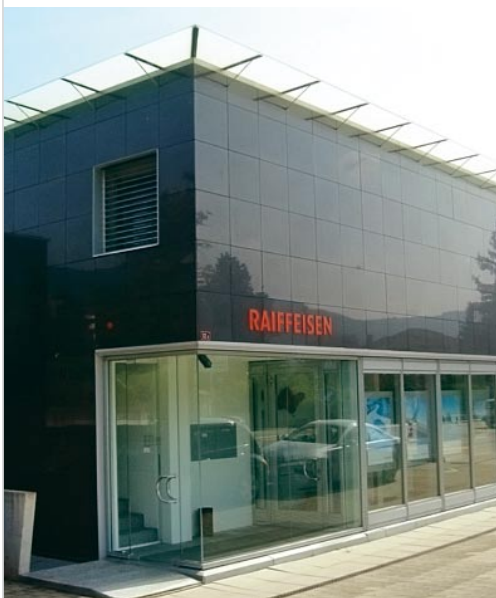
Banque Raiffeisen Canobbio-Comano-Cureglia Le bâtiment de la Banque Raiffeisen est une oeuvre d'art à lui seul.

Outre des expositions d'artistes de la région dans leurs locaux, les Banques s'engagent surtout dans le domaine artistique par des commandes