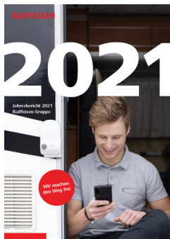
Rapporto annuale Gruppo Raiffeisen