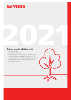
Allegato sulla sostenibilità (GRI, TCFD, UNEP-FI)