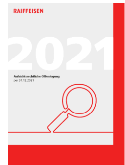
Informativa al pubblico