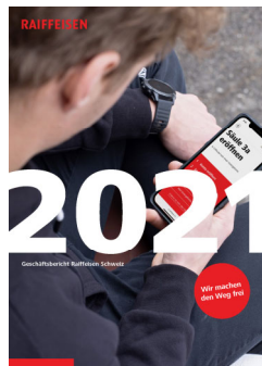
Rapporto di gestione Raiffeisen Svizzera