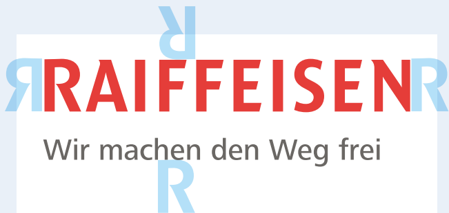
Schutzzone in Ausnahmefällen | Zone réserve dans le cas d'exception | Area di rispetto in casi eccezionali