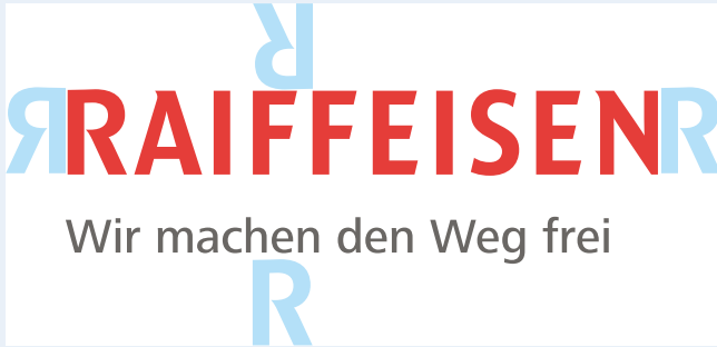
Schutzzone | Zone réserve | Area di rispetto